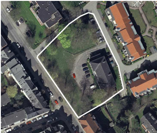
Abb. 2 Luftbild des Plangeltungsbereiches