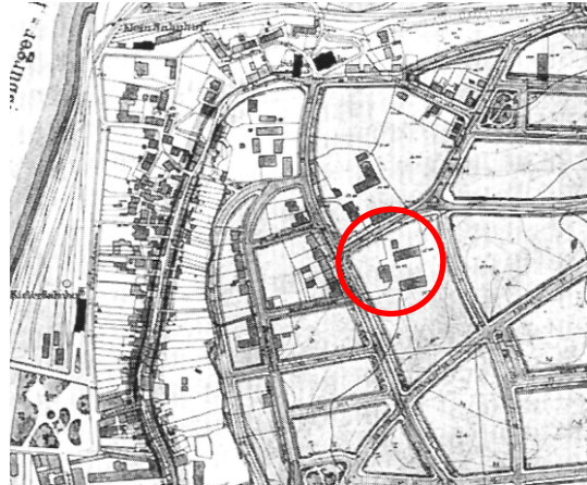
Abb. 3 Bebauungsplanentwurf für das östliche Stadtgebiet von Josef Stübben, 1904 (Hrsg. Landesamt für Denkmalpflege S-H: Kulturdenkmale in S-H Bd 2 Stadt Flensburg. Neumünster 2001)

Der Geltungsbereich umfasst das Grundstück Jürgensgaarder Str. 11 (Abb. 2). Das Gebäude ist das letzte erhaltene Gebäude der Höfe von Jürgensgaard (Abb. 3). Das ehemalige Gutshaus eines Dreiseithofes ist heute noch vorhanden, jedoch in seiner Gestalt wesentlich verändert. Die Fassade und das Dach wurden modernisiert, derzeit wird es durch eine Schule genutzt. Das Grundstück ist durch hohe Bäume eingefasst, der Baumbestand ist zum Teil sehr alt und für das Umfeld stadtbildprägend. In der näheren Umgebung findet sich überwiegend Wohnbebauung. Auf der gegenüberliegenden Straßenseite gibt es drei- bis viergeschossige gründerzeitliche Blockrandbebauung, welche einer Erhaltungssatzung unterliegt. Nördlich des Planbereiches besteht an der Jürgensgaarder Straße eine bis zu 8-geschossige gestaffelte Bebauung, östlich des Grundstücks befindet sich die Senioreneinrichtung Jürgenshof.