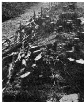
Was auf den ersten Blick wie Umweltfrevler wirkt, ist tatsächlich vorbildliche Knickpflege; die so "geknickten" Gehölze bilden neue Stockausschläge und wachsen zu einem dichten Gehölzstreifen

In den Folgejahren wachsen die Sträucher aber dank ihres kräftigen Wurzelwerks sehr schnell nach. Der Knick ist dichter als zuvor und wird dadurch ökologisch hochwertiger. Dieser Schnitt - genannt "Knicken" oder "auf