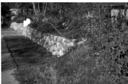
Dieses Beispiel zeigt wie ein Knick zugunsten eines Friesenwalls zerstört wurde

Mit dem Aufsetzen einer Steinmauer wird die knicktypische Vegetation des Knickwalles und des Saumes am Knickfuß beseitigt. Dies ist nicht zulässig. Es spricht aber nichts dagegen, einzelne Steine als Wärmespeicher im Knickwall einzubauen oder dort abzulegen.