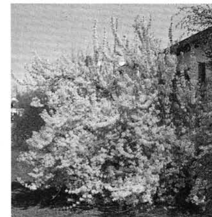
Der prächtig blühende Forsythienbusch eignet sich gut als Solitärgehölz. Für die Ökologie der Knicks spielt er allerdings keine Rolle

Ich hätte in meinem Knick gern mehr blühende Sträucher und Blumen. Darf ich Zierpflanzen (z.B. Forsythien) in den Knick setzen?